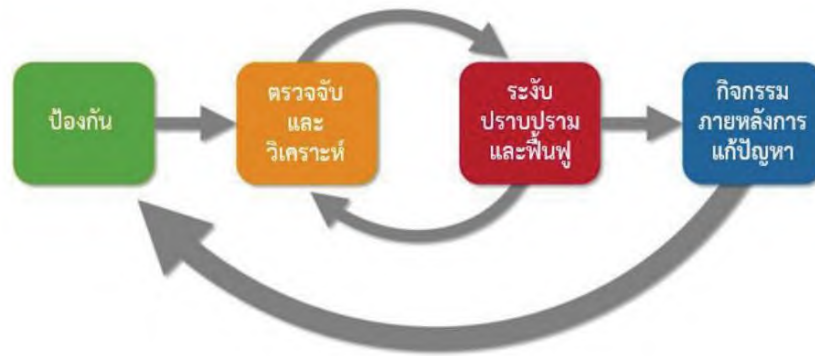
ภาพที่ 1 แสดงขั้นตอนการดำเนินการมาตรการที่เกี่ยวข้องเพื่อจัดการภัยคุกคามทางไซเบอร์ (Incident Handling Cycle)

มาตรการป้องกัน รับมือ ปรามปราม และระงับภัยคุกคามทางไซเบอร์แต่ละระดับนั้น มีการดำเนินมาตรการที่เกี่ยวข้องเพื่อจัดการภัยคุกคามทางไซเบอร์ (incident handling) โดยสามารถแบ่งขั้นตอนการดำเนินการออกได้เป็น 4 ขั้นตอนหลัก เพื่อให้สอดคล้องกับมาตรฐานหรือแนวทางปฏิบัติสากลที่เกี่ยวข้องกับการจัดการภัยคุกคามทางไซเบอร์ตามภาพที่ 1 และภาพที่ 2 ดังนี้